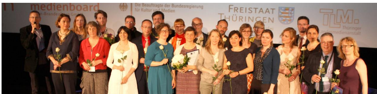
Abschlusspitching und Preisvergabe des Jahrgangs 2014/15.

Liebe Förderer & Freunde der Akademie für Kindermedien,